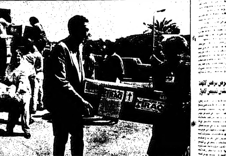
جنود الجيش الأمريكي في العراق، في جوار سيارة عسكرية تابعة للقوات الأمريكية.

وقال مسؤولون أمريكيون في وقت سابق أن صدام حسين قد استمر في الحكم في العراق حتى بعد هزيمته في حرب الخليج الأولى، وهو ما يفسر استمراره في الحكم حتى بعد هزيمته في حرب الخليج الأولى. وقال مسؤولون أمريكيون في وقت سابق أن صدام حسين قد استمر في الحكم في العراق حتى بعد هزيمته في حرب الخليج الأولى، وهو ما يفسر استمراره في الحكم حتى بعد هزيمته في حرب الخليج الأولى.